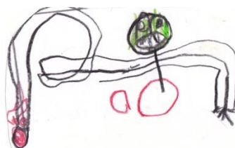
Ilyda, 5 Jahre